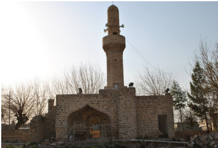
وئەنى ژماژە (۶۴۲) منارەي مزگەوتى خورمال. نوپۆزەر (2015)

✘ ئەم مزگەوتە ئەكەوئتە ناو ناحىەيى خورمال لەبەشى باكوورىيى خۆرەلاتىدا ئەكەوئتە بەشى رۆژئاوايى قەلاى كوئى گولعەنەبەر، لەبەشى خورمالى كۆندا، لە باكوورى مزگەوتەكەدا سەرچاوهيى ئاويكى زۆرەيە كە بە (كانى گەنجان) ناسراوه، كانى گەپراو و قەلاى گەپراو دەكەوئتە بەشى رۆژئاوايى مزگەوتەكە.