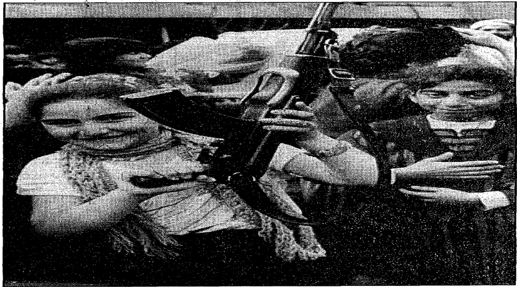
Up in arms: Kurdish girls flourish weaponry in strife-torn Harir, Iraq. Picture, Kaveh Celestian

سەرچاوه: (James, Ian Glover, et al, March, 1991, 24)