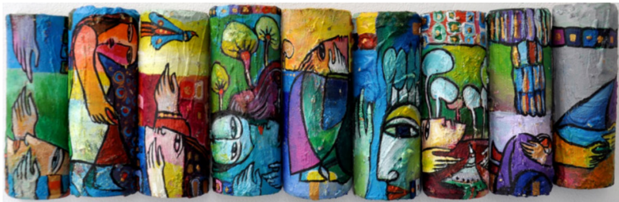
31, 12cm ,Acrylic on wood ,2010 ,Rebwar Rashed, Month of May Diary (detail), Kawasaki City Museum .units, Photograph by Rebwar Rashed

و پاشاکان، بهلام ریوار جیاواز له م ترادیسیۆنه رووخساری قوربانیانی جینۆساید و یادهوهرییهکانیان پیشاندهدات (Rashed, Rebwar, 2012). رووخساری ناو تابلۆکانی ریوار مردووین و تهماشامان دهکهن، ههر بۆیه لهبری ئهوهی بمانخه نه گریان، ئارامیمان پیده به خشن. تهماشاکردنی رووخسارهکان ژیاتمان له لا خوشه و پست دهکهن، نهک ته نیا مه رگمان بیر به پینه وه (سیوه یلی، 2020: 230-231).