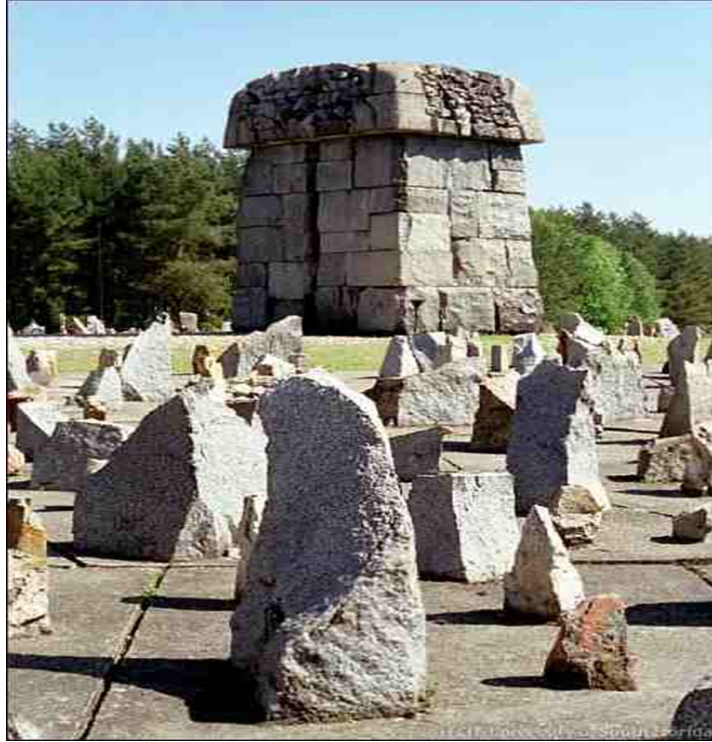
:Treblinka. Center monument side view.