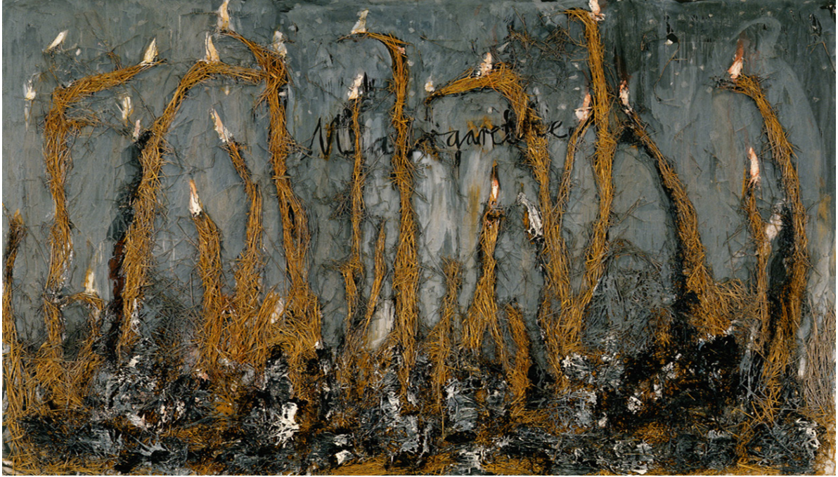
oil, grass on canvas ,۱۹۸۱ Anselm Kiefer, Margarethe

حەزى كىفەر بۇ ئەدەب و بەكارهيتانى تىكىست لە ئىشەكانىدا وەھا دەكات، كىفەر ئايدىا ئەدەبىيەكانى سىلان بۇ ھونەرى بىنراو بگوازىتەوہ بۆئەوہى لىروانەر ھانبدات ھەتاكو ترازيدىاي ھۆلۆكۆست بېرچىنن. لە ھۆنراوہكەدا ماگەغىتۆ قزى زەردە، لە تابلۆكەدا بەرپى پووشەوہ سىمبولىزەكراوہ، كە پووش بووہ بە مىدىۆمىكى دووبارە لە ئىشەكانى دىكەى كىفەردا، بەلام لىرەدا بۇ يەكەم جارە بەكاردىت. پووش بەھۆى توانستى سەوزبوونەوہ و وشكبوونەوہوہ، كىفەر وەك سىمبولى سوورپى ژيان، پەتەتى (پاكزىتى) نەژادىي (race) و خۆشەويستىي ئەلمانىي بۇ خاك بەكاردەھىننىت. ھەرەھا پووش دەگەرپتەوہ بۇ ئەفسانەى ئەلمانى «رەمپلستىلسكن» كە پووشى كردوہ بە زىر. كىفەر ناوى ماگەغىتۆى بە رەنگى رەش لەسەر كانقاسەكە نووسىوہ و ھەندى ناوچەى تابلۆكەشى رەشكردوہ وەك ئاماژەيەك بۇ ھەبوونى بىدەنگى لەبارەى شولەمايتى سامى و ھەرەھا زۇر بەگشتىي ئاماژەيە بۇ ژمارەيەكى زۇر قزى رەش لە ئاوشقىتس (Biro, ۲۰۰۳).