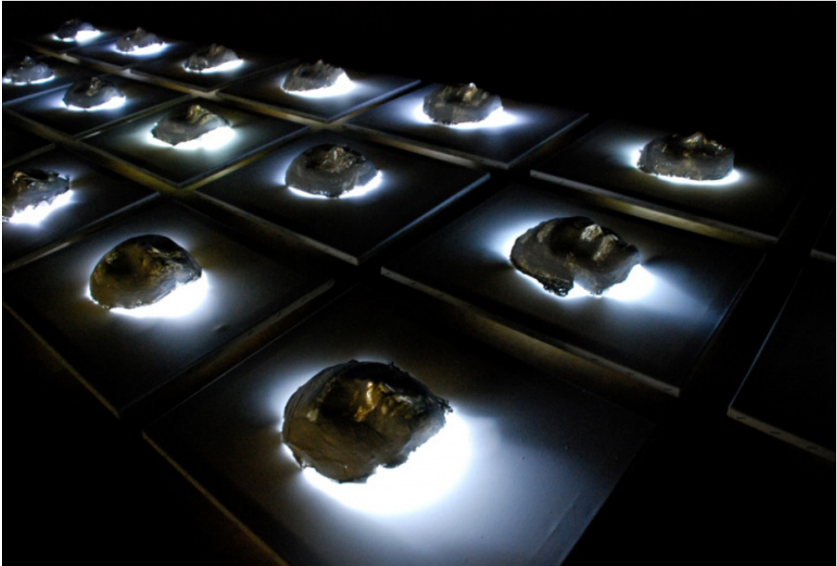
20, 30 cm x 40 cm, Chocolate Factory, London, Mixed media, 2008, 20th Anniversary Rebwar Rashed, Anfal units, Photograph by Rebwar Rashed

ههيه و له خۆيدا ئەم تراژىديايه بهرجهسته ده كات. به هاى كه رهسته له نيو ره هه نده ميژوويى، كۆمه لايه تىي و سياسىيه كانىديايه (Rashed, Rebwar, 2012, 64, 69).